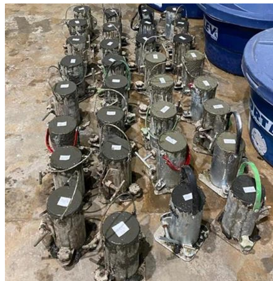
Figura 7 - Corpos de prova moldados