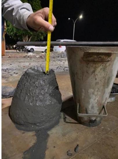
Figura 5 - Realização do slump test