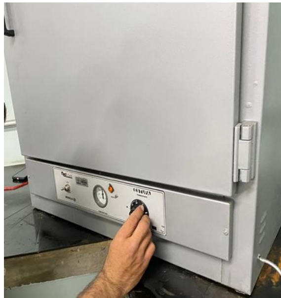
Figura 3 - CBC em estufa