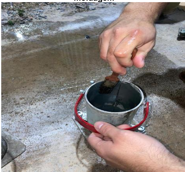
Figura 6 - Preparação dos cilindros para moldagem

Foram moldados, para cada traço, seis corpos de prova, totalizando 24 amostras (Figura 7). Os corpos de prova foram identificados com etiquetas fixadas na parte superior, logo após a moldagem. Depois de retirado das formas, 24 horas após a moldagem, foram identificados com marcações ao longo da peça e submersos em tanque com água (Figura 8).