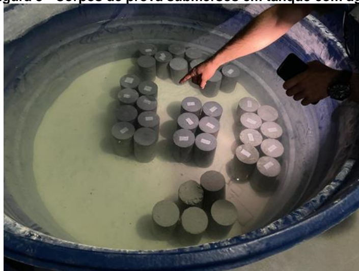
Figura 8 - Corpos de prova submersos em tanque com água