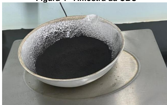
Figura 4 - Amostra da CBC