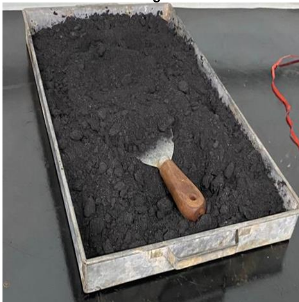
Figura 2 - CBC em bandeja metálica para secagem