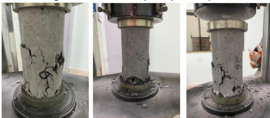
Figura 9 - Amostras de corpos de prova rompidos

Para cada dia de ensaio definido (7, 14 e 28 dias) romperam-se oito corpos de prova, dois para cada traço (Figura 9).