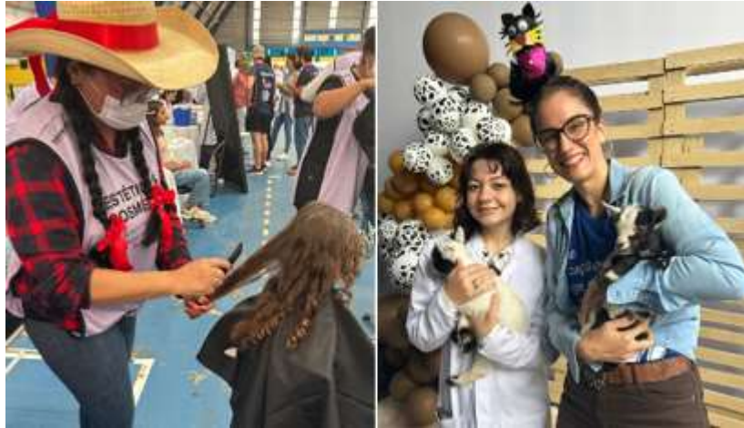
Figura 4 - Atuação Docente em Ações Extensionistas nos Cursos de Estética e Cosmética e Medicina Veterinária da UniEVANGÉLICA/2025