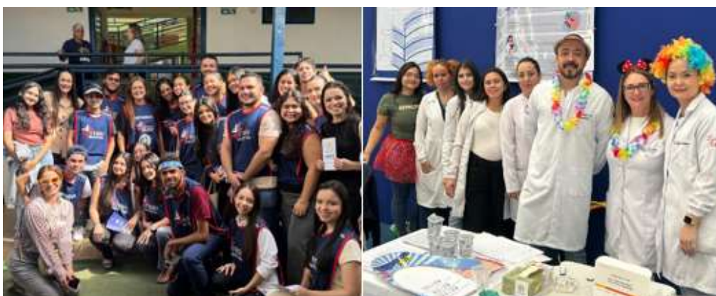
Figura 3 - Vivências Extensionistas nos Cursos de Direito e Biomedicina da UniEVANGÉLICA/2025

Além dos indicadores quantitativos, foram realizadas visitas técnicas às coordenações de curso, com o objetivo de compreender, a partir do diálogo direto com os Coordenadores de Cursos, Núcleos Docentes Estruturantes (NDEs) e Colegiados de Cursos; as repercussões qualitativas da extensão curricular na prática docente. As conversas evidenciaram que as ações extensionistas têm provocado reconfigurações significativas no modo como os professores planejam, conduzem e avaliam suas disciplinas, ampliando a intencionalidade formativa e o compromisso social do fazer pedagógico. Relatos recorrentes indicaram fortalecimento do vínculo com o território e ressignificação do papel do professor como mediador entre conhecimento científico e demandas sociais. Nesse sentido, a extensão curricular tem se configurado como espaço de reafirmação da vocação docente na universidade, pois permite articular propósito formativo, responsabilidade social e identidade profissional. As imagens abaixo evidenciam a inserção ativa de docentes de diferentes cursos de graduação da UniEVANGÉLICA em ações de extensão curricular realizadas em 2025.