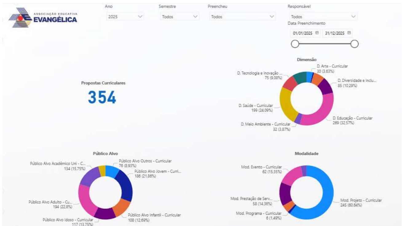
Figura 2 - Distribuição das Propostas de Extensão Curricular por Dimensão, Público-Alvo e Modalidade/2025