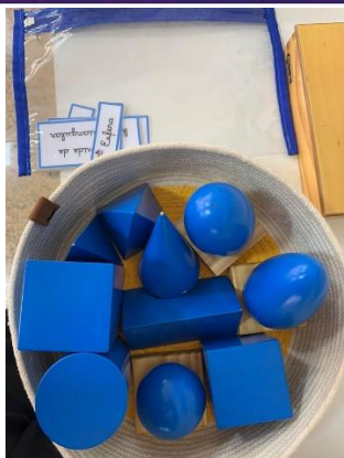
Imagens 12 e 13: Estantes na altura dos alunos, organizadas por áreas de estudo.