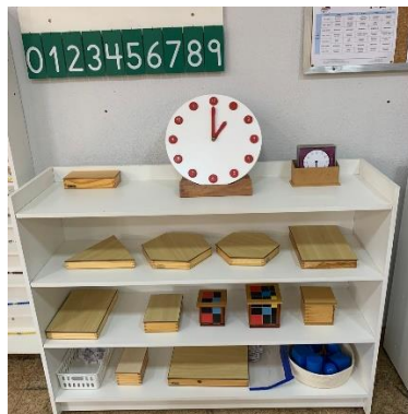
Imagem 14: Estante para estudo da vida prática.