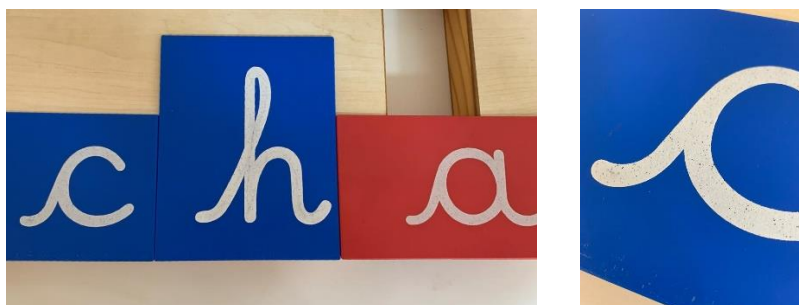
Imagem 3: Alfabeto móvel cursivo em MDF para montagem de palavras no tapete caligráfico.

Imagens 1 e 2: Placas de alfabeto cursivo em lixa.