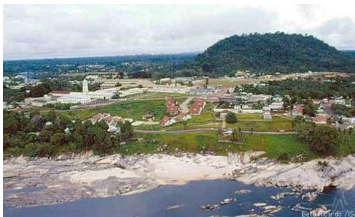
Figura 1 – Vista aérea da cidade de São Gabriel da Cachoeira

Fonte – site: antigo.socioambiental.org/noticias/nsa/detalhe?id=2136 > Acesso 29/09/2018