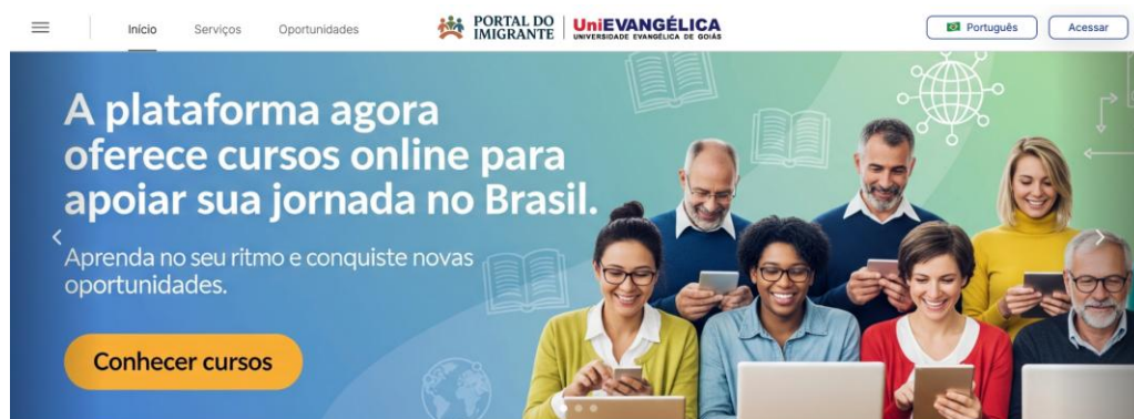
Figura 1. Tela Inicial do Portal de Atendimento ao Imigrante da UniEVANGÉLICA

O portal oferece uma experiência acessível e inclusiva aos imigrantes, reunindo em um só ambiente páginas com conteúdo informativo, como Guia de Documentos, Eventos e Vagas de Emprego, todas constantemente atualizadas pela equipe do NPJ. Além disso, disponibiliza ferramentas interativas como a seção de Perguntas Frequentes (FAQ) para esclarecer as dúvidas mais comuns, um Formulário de Documentação que auxilia na identificação dos documentos necessários e um sistema de agendamento online, que permite marcar atendimentos com praticidade, evitando deslocamentos desnecessários. Para ampliar o alcance e garantir a usabilidade por um público diversificado, o portal conta ainda com suporte multilíngue em português, inglês, espanhol e francês.