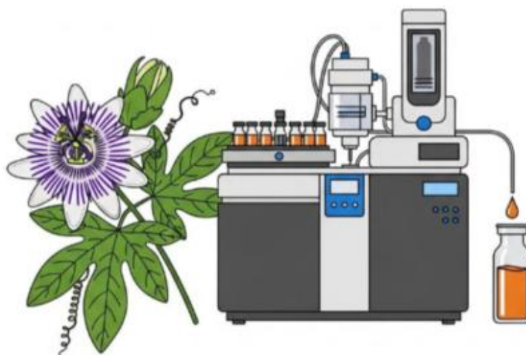
Figura 1. Esquema da extração e análise por HPLC

A Figura 1 ilustra, de maneira esquemática e didática, o processo de extração e análise cromatográfica dos compostos da Passiflora edulis , evidenciando a associação entre a matriz vegetal e o equipamento laboratorial de HPLC.