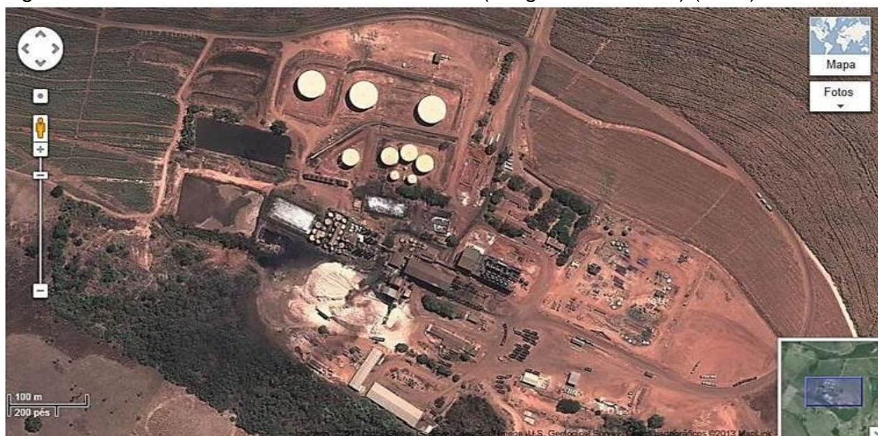
Figura 2: Indústria alcooleira de Rubiataba –GO (imagem via satélite) (2018).